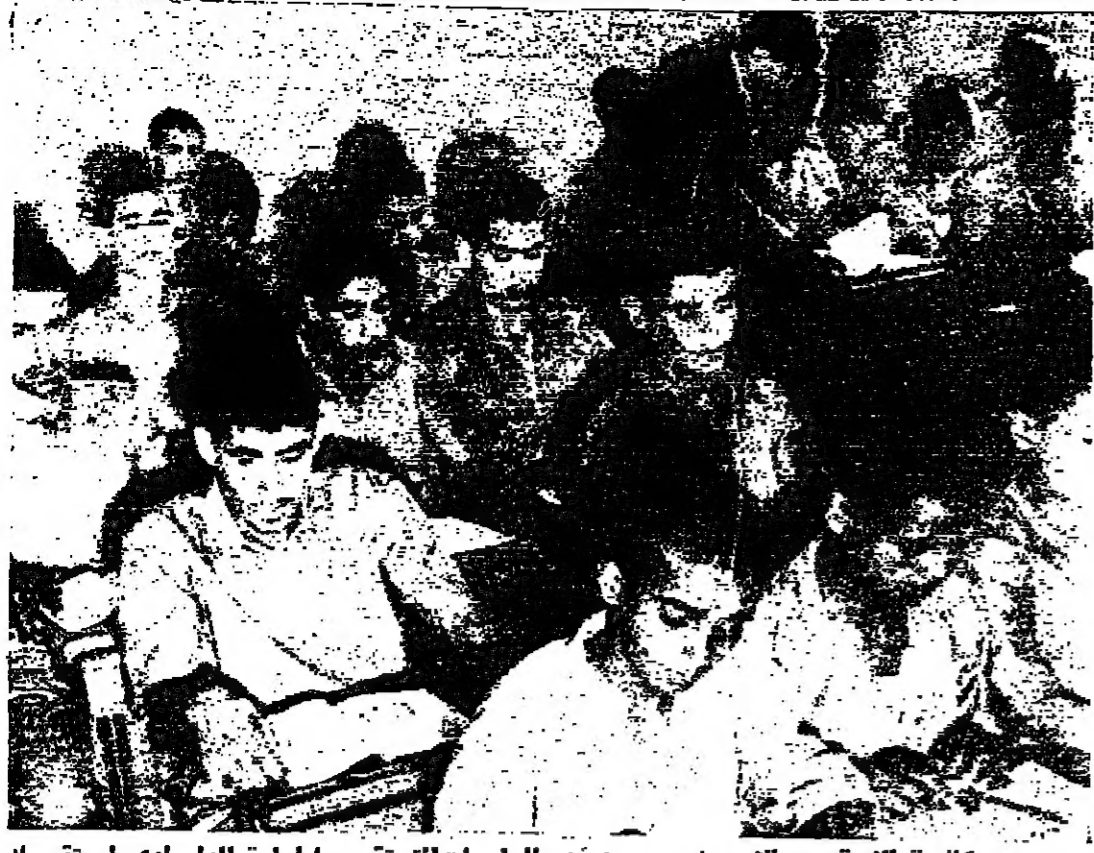
مكافحة الأمية بين الأحداث ... من أهم الواجبات التي تقوم بها إدارة الدار لدى استقبال الأحداث

قبل الخامس من حزيران ١٩٦٧ كان هناك العديد من الأحداث الذين تضمنهم التوقيف والاعتقال .. في دار التوقيف والاعتقال بعمان .. بعضهم يوضع رهن المراقبة والبعض الآخر يوضع نتيجة صدور حكم معين عليهم .. وكانت مثل هذه الدور منتشرة برعاية الدولة في عمان والتمس ورام الله .. بالإضافة الى دور الرعاية الاجتماعية التي كانت تؤدي دورها في الضفة الغربية قبل العدوان الإسرائيلي على الدول العربية ..